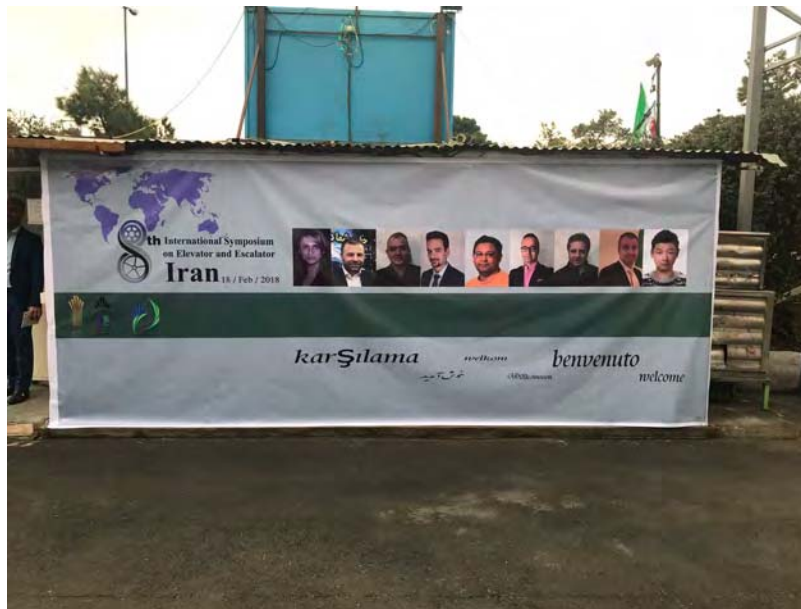
A welcome banner greets participants and visitors.