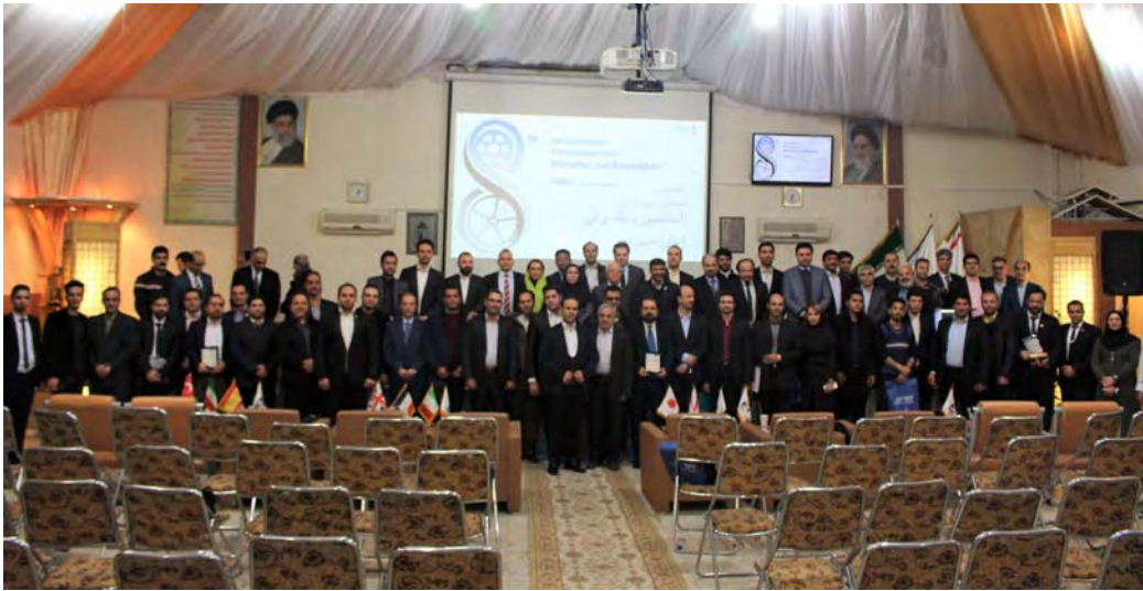
Dignitaries and guests