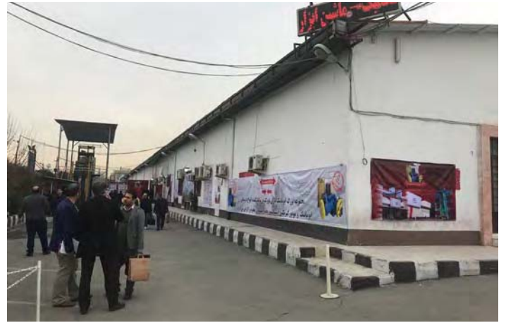
The Koosha Center was the venue for the symposium.

تعرض مجموعة متنوعة من مصنعي مكونات VT منتجاتهم خلال معرض في الندوة.